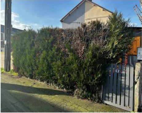
Existant : haie en mauvais état phytosanitaire