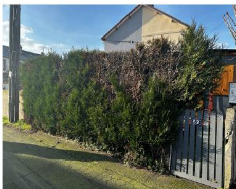
Existant : haie en mauvais état phytosanitaire